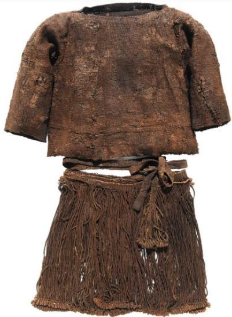
Vestuário na Pré-História Imagem 3: Roupas femininas encontradas no túmulo de Egtved na Dinamarca, Museu Nacional da Dinamarca, Copenhague