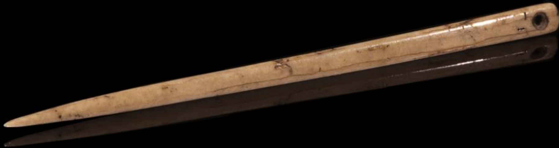
Vestuário na Pré-História Imagem 1: Agulha de osso plano com 59x3x2 mm do final do período Paleolítico Superior (entre 17.000 e 10.000 antes da era atual) coletada na Caverna Gourdan por Henri Filhol